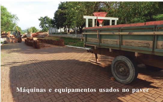
Máquinas e equipamentos usados no paver