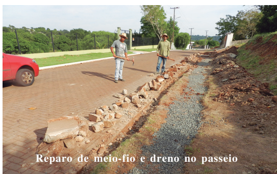
Reparo de meio-fio e dreno no passeio