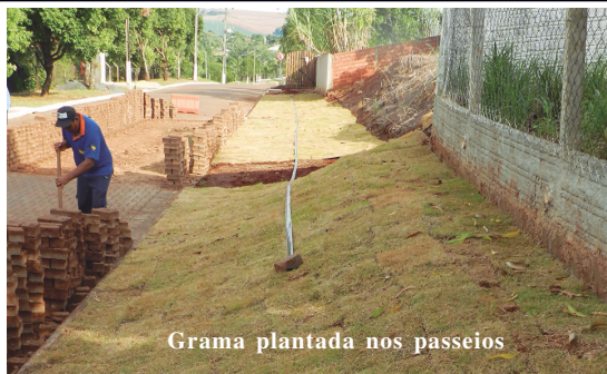
Grama plantada nos passeios

Outra providência determinada pelo Síndico foi o plantio de grama nos passeios ao longo da Rua Cardeal. A grama, além de embelezar o ambiente pelo seu verde, contribui decisivamente para a melhoria ambiental.