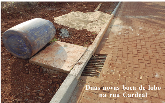
Duas novas boca de lobo na rua Cardeal