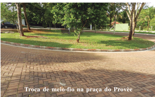
Troca de meio-fio na praça do Privée

os efeitos do sol e calor, podem conversar à vontade, é um atrativo aos moradores daquela região, um verdadeiro convite às reflexões.