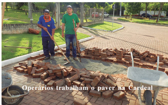
Operários trabalham o paver na Cardeal

Na foto verifica-se fotos, o bucolismo do banco existente no centro da Praça onde as famílias podem sentar para exercícios de higiene mental, abrigados pela arborização que reduz